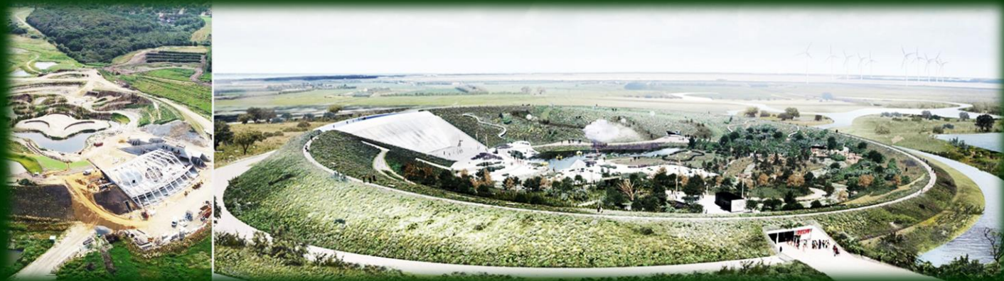
Naturkraft Oplevelsescenter, Ringkøbing Opdagdanmark.dk

De oplevelser, som danske kulturinstitutioner tilbyder turisterne, er nu mere involverende, og det tiltrækker i den grad flere turister. Både fra internationale nær- og fjerne markeder, men også flere danskere vælger, at holder ferie i Danmark.