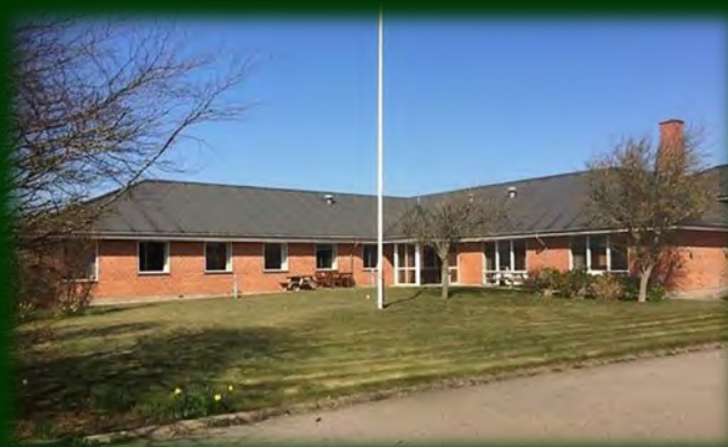
Det tidligere Stadil Plejehjem

Der er ingen tvivl om, at mange af vores ældre medborgere lider et stort afsavn i disse dage, hvor besøg fra pårørende og frivillige ikke er mulige. Som Social- og Sundhedsudvalgsformand er det absolut også på dette område, at jeg har modtaget flest henvendelser, da der naturligvis er rigtig mange, der bekymrer sig om, hvordan hverdagen for vores plejehjemsbeboere forløber. Det er en svær tid for alle – og særlig for de allermest sårbare og udsatte i vores samfund. Udfordringen er naturligvis, at vi ved at åbne vores plejehjem for besøg jo samtidig udsætter navnlig de svageste borgere for en stor risiko.