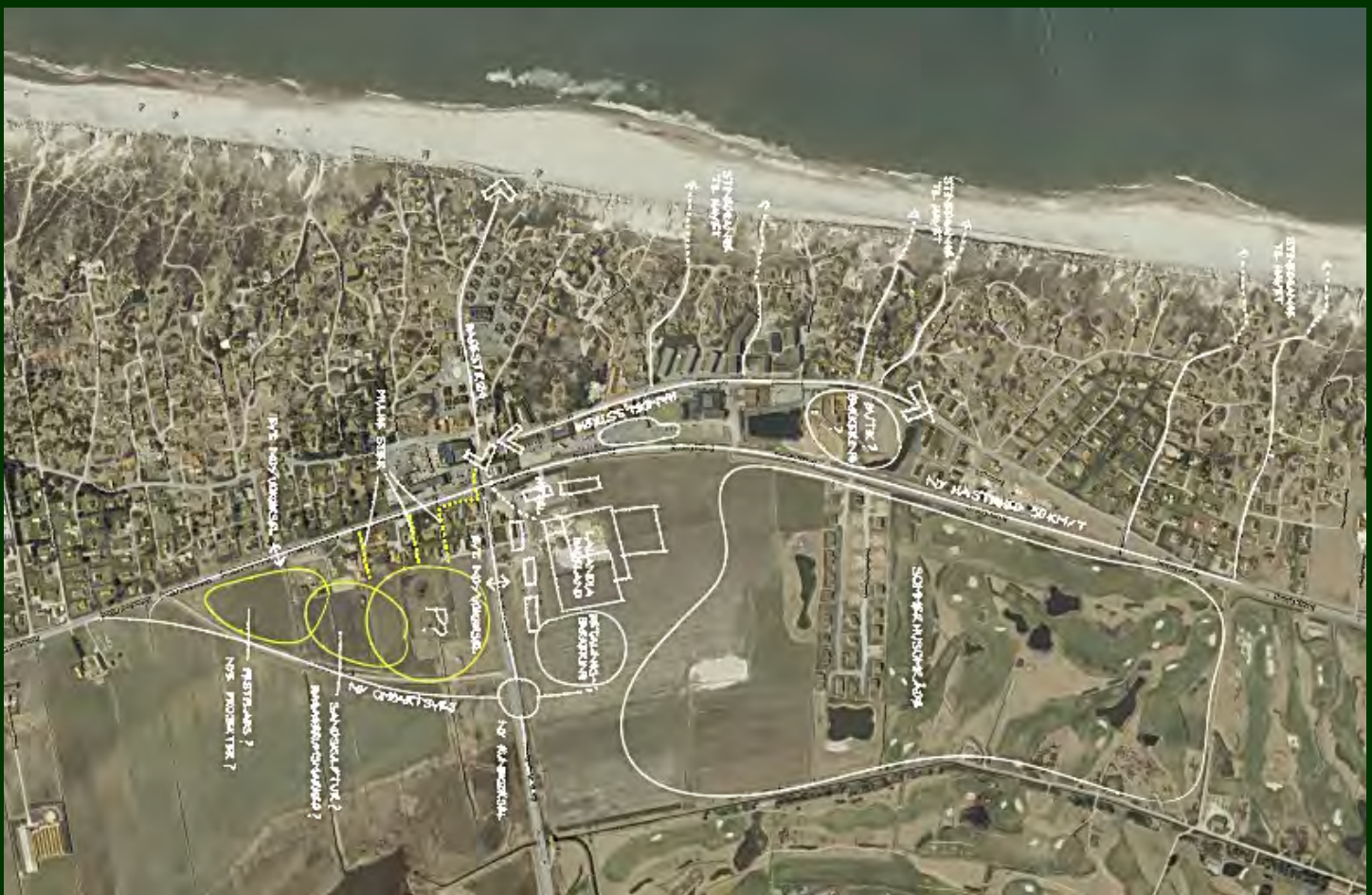
Teknik- og Miljøudvalgsmøde 14.april 2020, Kort med indtegninger af idéer 6. udg. reduceret

Jeg er helt enig med beslutningen i Teknik- og Miljøudvalget, som giver Salling Group lov til at undersøge muligheden for detailhandelsbutik i "Nyhavn", som området syd for den kommende rundkørsel i Søndervig kaldes.