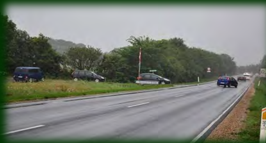
Hovedvej A11

Men udover forbedringer af hovedvej A15, så har vores lokale erhvervsliv også efterspurgt forbedringer på hovedvej A11, der forbinder kommunen i den sydlige retning. Her er det i særlig grad for små rundkørsler samt for lave broer, som giver udfordringer, når større lastemner skal transporteres.