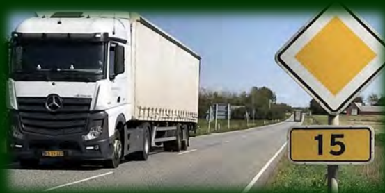
Hovedvej A15

Det har i meget lang tid været et ønske at få udbygget vores hovedveje i Ringkøbing-Skjern Kommune. Oftest har behovet for forbedringer på vejen mellem Herning og Ringkøbing og videre til Hvide Sande været nævnt, ikke kun set i lyset af åbningerne af de kommende nye attraktioner med Lalandia og Naturkraft, men også i forhold til den generelle forventede vækst i turismen. Hertil kommer også et øget transportbehov fra alle vores produktions- og landbrugsvirksomheder.