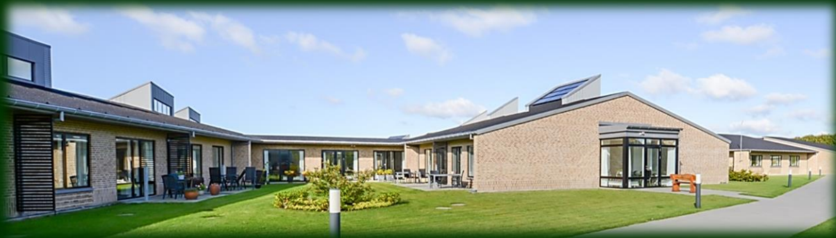
Fjordparken Ældrecenter

Med den forventede øgede tilgang af ældre medborgere har vi længe vidst, at vi i fremtiden vil få behov for både flere ældreboliger og plejeboliger. Men præcis hvor mange vi får brug for samt præcis, hvilke typer af boliger – og ikke mindst hvor de skal ligge – har vi haft brug for at få undersøgt nærmere.