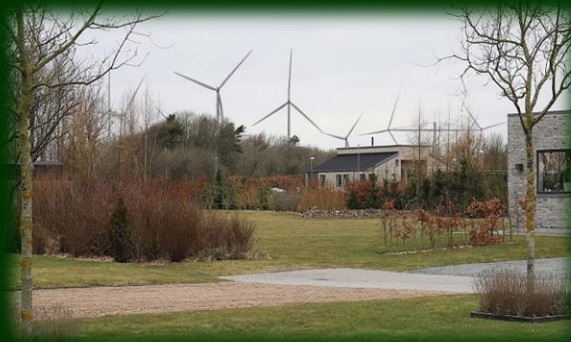
Visualisering af 200 meter høje testvindmøller.

Det er tydeligt, at mange borgere efterlyser betydelig mere gennemsigtighed i de beslutninger, vi træffer, og ikke mindst også efterspørger en klar og tydelig plan. Lige nu virker det hele en smule ustruktureret, og det virker ikke som om, at der er en overordnet plan. Det skaber en masse frustration blandt kommunens borgere, og flere bysamfund ved ikke, om de er købt eller solgt, og hvad de kan forvente af fremtiden.