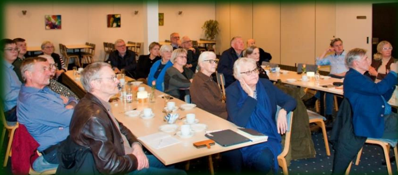
....Og der blev lyttet med stor opmærksomhed!

Efter beretningerne var der valg af formand og næstformand, 2 nye medlemmer af bestyrelsen og 2 suppleanter til disse, hvortil kom valg af delegerede til Landsråd samt valg af 2 revisorer.