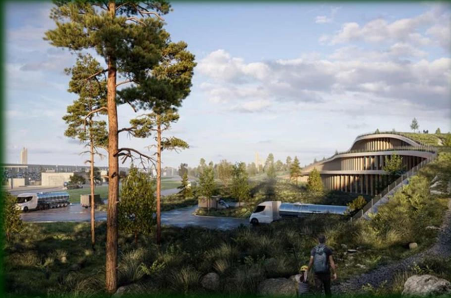
Megaton, illustration, GreenGo Energy

Syd for disse transformeranlæg skal det viste på nedenstående billede opføres. Selve dette anlæg skønnes at fylde ca. 40 ha.