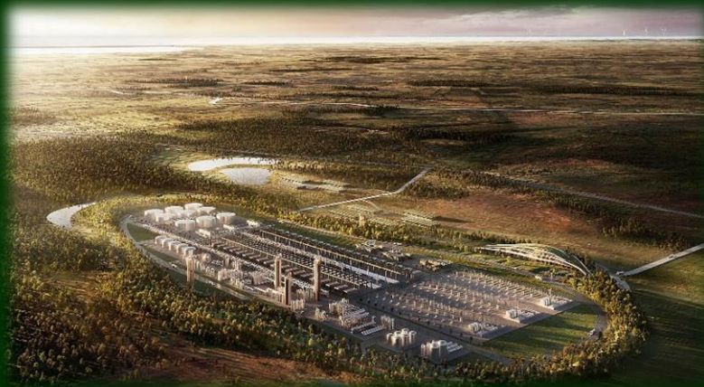
Megaton, illustration, GreenGo Energy

Energi-øer: Som omtalt i sidste nummer af Nyhedsbrevet, havde vi forventet en udmelding omkring statens energi-øer, men det er stadig ikke meldt ud, hvor staten ønsker at placere disse øer.