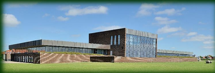
Ringkøbing-Skjern kommunes rådhus

Jeg håber at se flere gode kandidater komme frem. Er det dig?