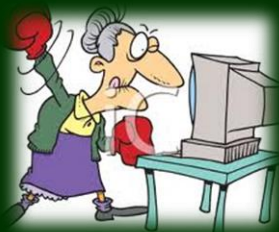
"Nej tak til grovheder!"

De sociale medier spiller en stadig større rolle i den offentlige debat, og desværre ser vi ofte, at tonen på disse platforme bliver både hård og personlig. Dette er en uheldig udvikling, som jeg naturligvis tager skarpt afstand fra. Det er vigtigt, at vi har en konstruktiv og respektfuld meningsudveksling, hvor fokus er på saglige argumenter frem for personangreb.