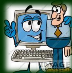
"Ja tak til en ordentlig tone!"

Lokalt oplever jeg, at tonen mellem politikerne generelt er rigtig god, men der er skribenter på de sociale medier, som specielt de seneste par år anvender ord og en tone, som ingen steder hører hjemme. Det er nemt at sidde bag skærmen og sende en byge af personlige ukvemsord af sted.